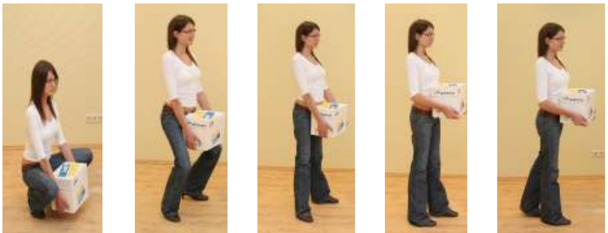
Рисунок 3. Правильное перемещение тяжелых предметов