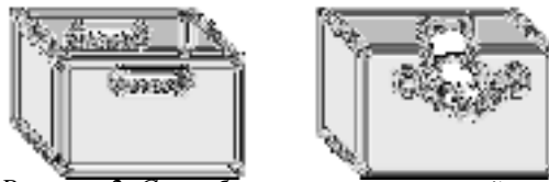
Рисунок 2. Способы захвата тяжестей