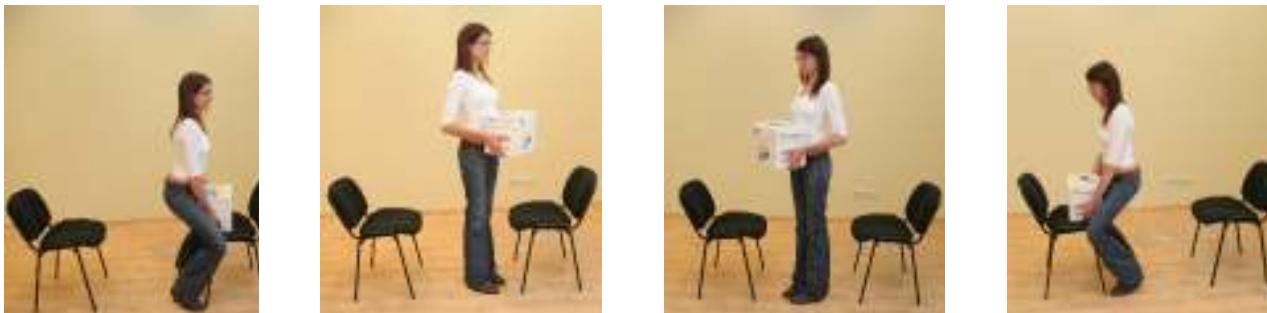
Рисунок 4. Правильное перемещение тяжелых предметов